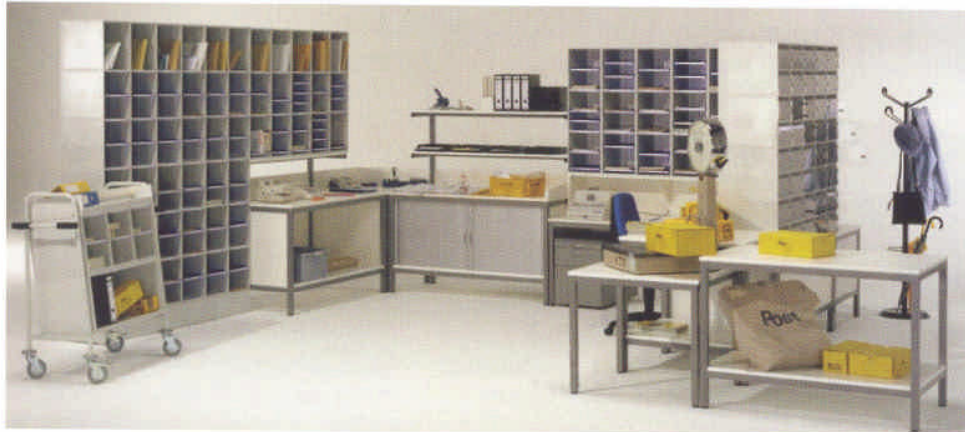
Aushängeschild: Komplettlösung einer Postverteilanlage mit Sortier- und Schließfächern, Möbeln und Fahrzeugen

Wöchentlich verlassen mehrere große Lastwagen das Firmengelände der in Steinen in der Schweiz ansässigen Spichtig AG mit Schubladenboxen, Postsortieranlagen und anderen Büroorganisationsmitteln. Neben dem Heimat-